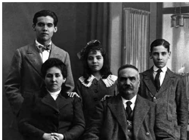
Der junge Federico mit seinen Eltern und seinen Geschwistern Concha und Francisco

Lorcas Werk, sowohl bestimmte Themen und Motive als auch die von Gibson genannten sprachlichen Besonderheiten, gehen zurück auf seine Kindheit und die Landschaft, die sein ästhetisches Empfinden früh geprägt hatte. Die vielfältigen Bedeutungen der Farbe Grün, die vor allem sein lyrisches Werk durchziehen, die metaphernreiche Sprache der Dienstmädchen in den Dramen, die Kraft der Naturphänomene in den Gedichten, z. B. des Windes oder des Wassers – all das deutet darauf hin, dass die frühen Erinnerungen aus der Kindheit, aus der er verschiedene Episoden immer wieder aufleben lässt, in seiner schöpferischen Vorstellungskraft sehr intensiv nachwirkten.