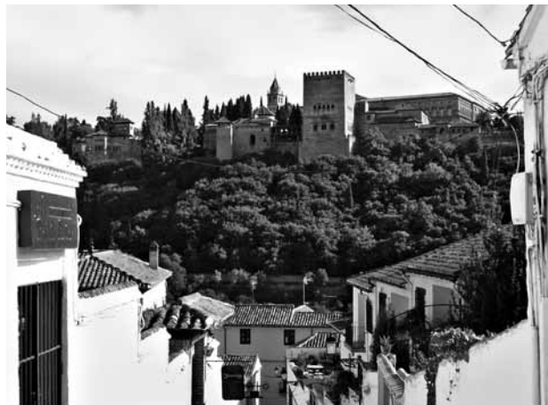
Blick auf Granada mit der Alhambra

Ab September 1910 besuchte Federico in Granada ein Privatinstitut, das »Colegio del Sagrado Corazón de Jesús«. Anders als sein Bruder Francisco war er allenfalls ein mittelmäßiger Schüler. Seine eigentliche Leidenschaft galt der Musik, und in Granada begann er bei einem erfolglosen Komponisten, aber