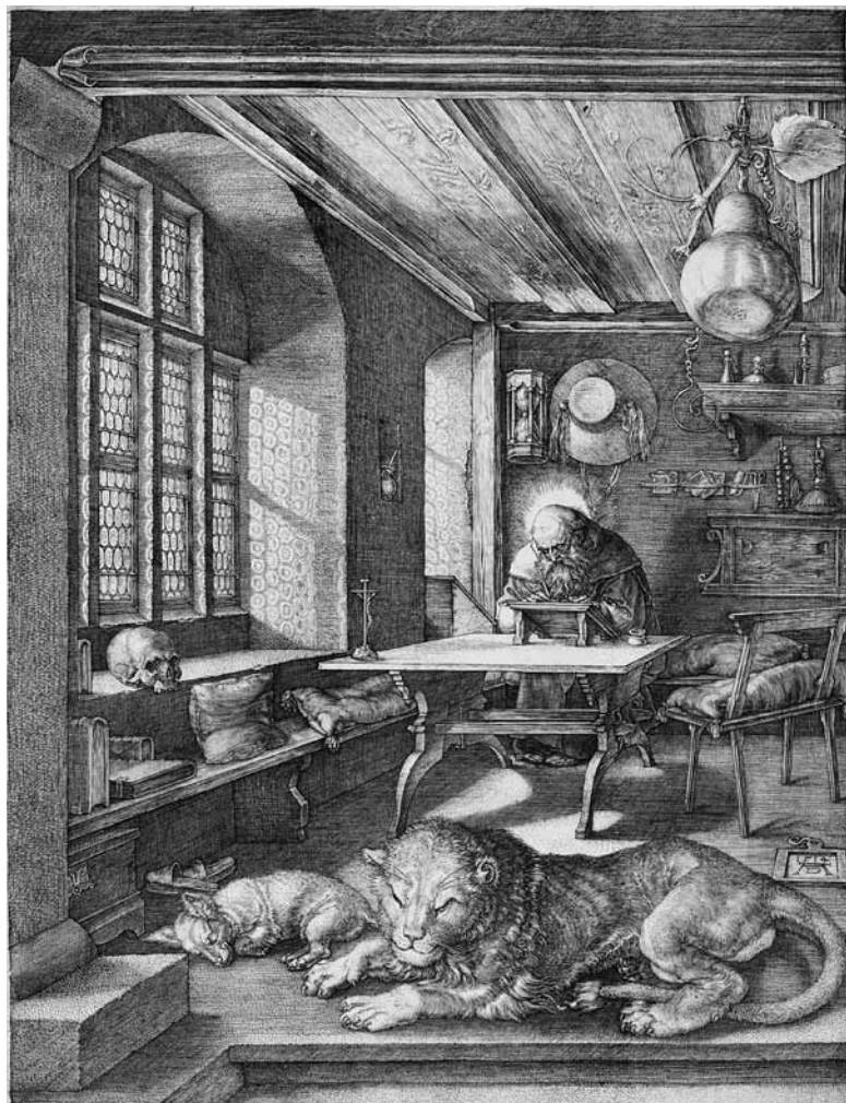
Abb. 1: Albrecht Dürer, Hieronymus im Gebäu , 1514, Kupferstich, 249 x 189 mm, Braunschweig, Herzog Anton Ulrich-Museum, Kupferstichkabinett