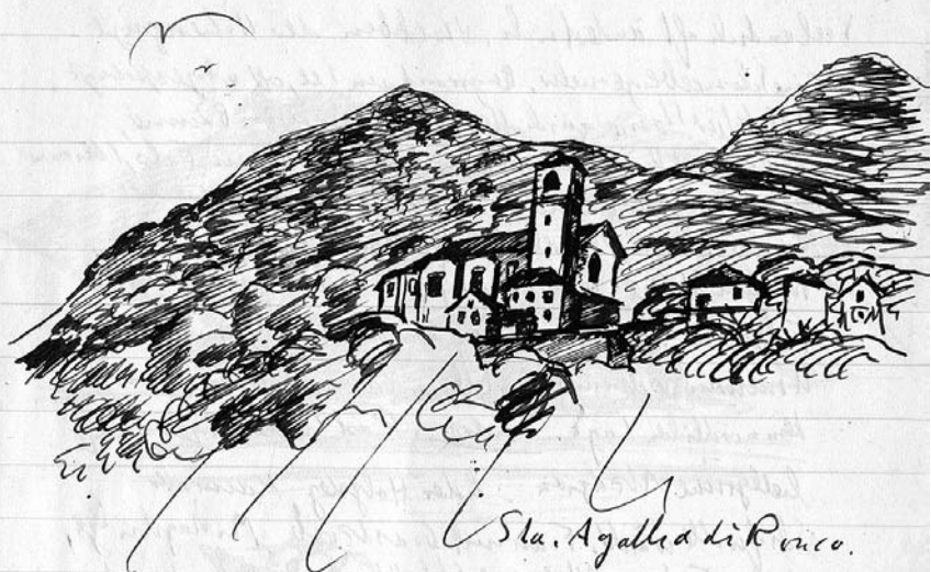
Sta. Agalla di Ronco.

Abendessen. Velle, Banerleute, Pommen u. Kammern. Gardiner- abwechseln an einem Sandtöpfen an der Flussmündung. Moos, gleich- mässiger Landbau.