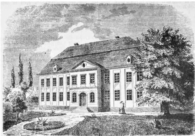
Schloß Lubowitz bei Ratibor an der Oder

cen, und so verpfuscht er selbst sein Leben. Beim Leser ruft er dabei Sympathie und Mitleid hervor, zumal der Held dieser fiktiven Autobiographie lernt, mit Pannen und Mißerfolgen umzugehen – darin dem Simplicius Simplicissimus Grimmelshausens oder dem Schelmuffsky Reuters ähnlich. Niemals verliert dieses Alter ego Eichendorffs seinen Mut; alles, was ihm zustößt, nimmt er komisch.