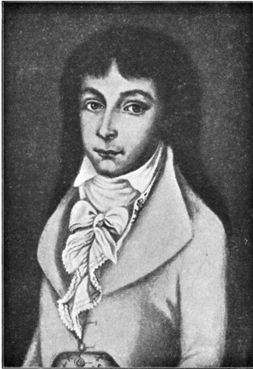
Joseph von Eichendorff im Jahre 1797

Der ausformulierte Anfang der Erzählung reißt nach wenigen Kapiteln ab; auf anderen erhaltenen Blättern überlieferte autobiographische Entwürfe passen nur zum Teil zu dem Geburtskapitel. Am ehesten ließe sich die Episode vom Abschied aus dem Elternhaus dem Leben des Unstern -Helden einpassen; und in diesem Kontext nennt Eichendorff seinen tumben Helden denn auch »blöde« und »verlegen« und bezeichnet ihn als Verkörperung von Uhlands Unstern . Die Skizze der »Novelle« setzt mit der Abreise des Helden aus dem heimatlichen Schloß ein.