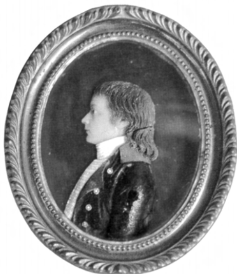
Joseph von Eichendorff im November 1800

zusammenhängend formulierte Textpassagen, die vorliegen, beispielsweise zur Novelle aus dem Dreißigjährigen Kriege oder der Geschichte von zwei Brüdern, die Reminiszenzen der Beziehung Josephs zu seinem wenig älteren Bruder Wilhelm enthält.