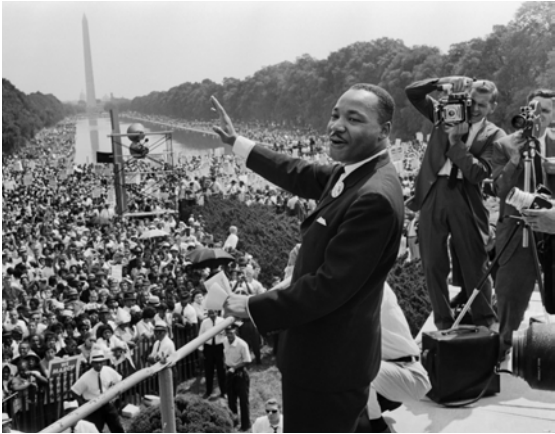
1. Martin Luther King beim Marsch auf Washington, D.C., 28. August 1963