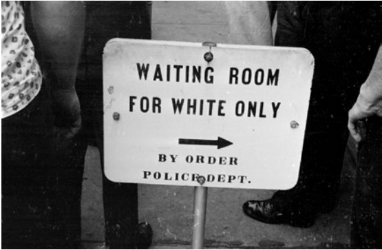
2. Rassismus im Alltag: getrennte Warteräume