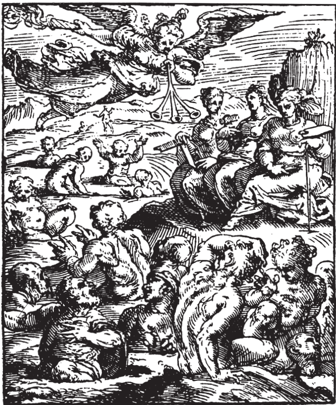
Abb. 1: Giorgio Vasari, Frontispiz zu Le vite de' più eccellenti pittori, scultori e architettori , Florenz 1568. Holzschnitt (Ausschnitt).

nie dieser Wiedererinnerung oder Wiederauferstehung. 3 Von da an – seit dieser Wiedergeburt, die ihrerseits aus einer Trauer hervorging – scheint es etwas zu geben, das man Kunstgeschichte nennt (Abb. 1). 4