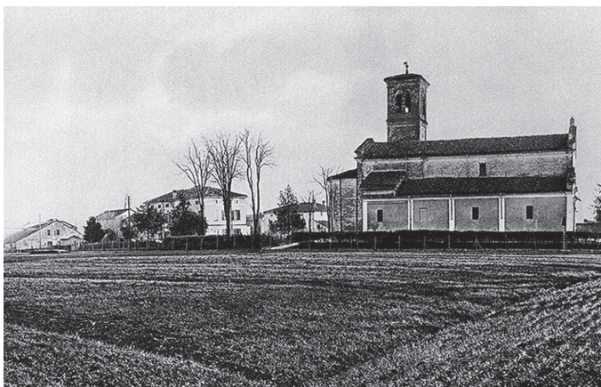
Verdis Heimatdorf, ganz links sein Geburtshaus

Busseto war einst Sommersitz der Herzöge Pallavicino gewesen. An sie erinnert eine prächtige Villa und die auf Fun-