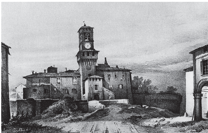
Die Rocca Pallavicina in Busseto

Bei einer von Adligen und Mailänder Bürgern getragenen Konzertgesellschaft, wiederum einem Liebhaberensemble, sprang Verdi eines Tages als Korrepetitor bei einer Probe zu