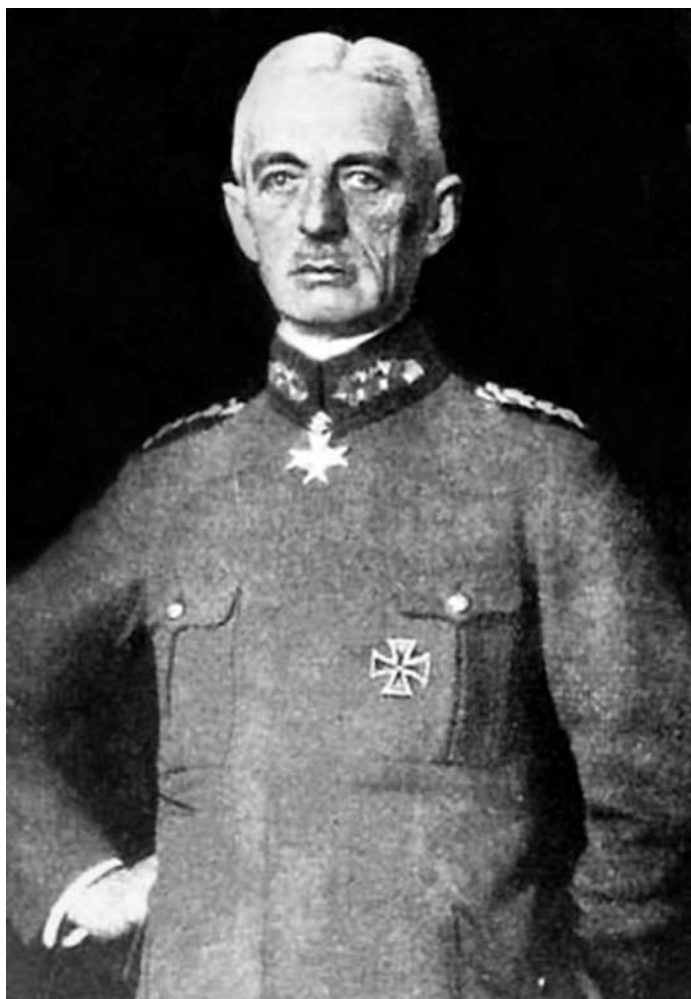
Walther von Lüttwitz, zwanziger Jahre