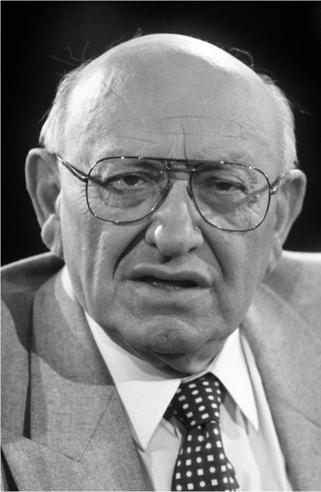
Abb.1: Marcel Reich-Ranicki. Portraitfotografie vom 22. April 1994 in Hamburg