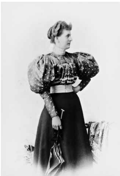
Die Mutter, 1894

Die emotionale Nähe zur Mutter war allerdings auch ökonomisch bedingt, als Frisch nach dem Tod seines Vaters im März 1932 als junger Mann nochmals mit seiner Mutter umzog: Die Familie musste sich einschränken, Frisch musste Geld verdienen. Bis zuletzt aber blieb das Idealbild der Mutter erhalten, auch physisch: Ein Jugendbild der Mutter erhielt stets einen besonderen Platz in seinen Wohnungen.