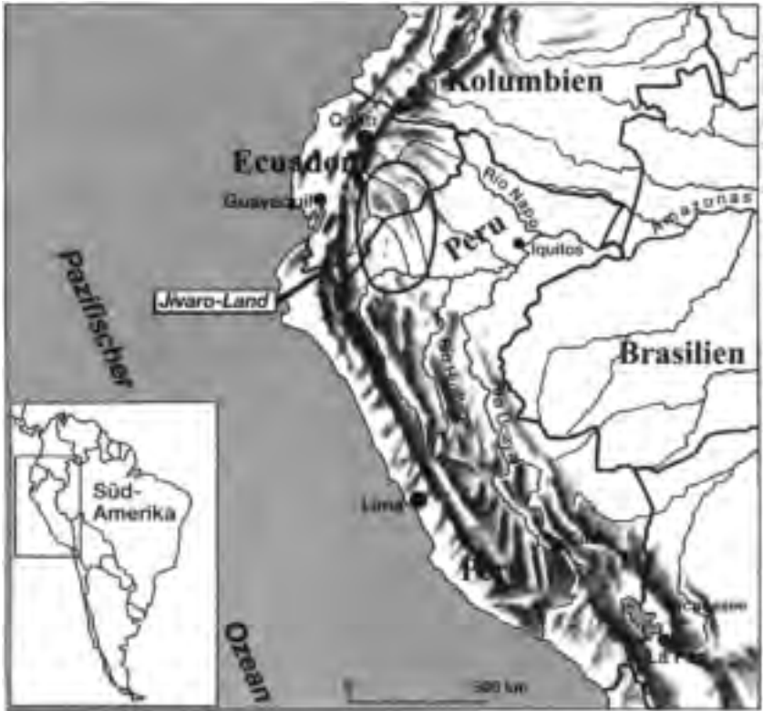
Das Jivaro-Land in Südamerika

Puyo, einer Siedlerstadt am Ostrand der ecuadorianischen Anden, absorbiert von einer gnadenlosen Gegenwart. Dem Besucher aus Europa, ja sogar dem, der aus den alten, geschützt in den hohen Tälern der Kordillere liegenden Kolonialstädten kommt, bietet Puyo den überraschenden Anblick einer Welt ohne wirkliche Vergangenheit. Gewiß, diese kleine Provinzhauptstadt ist nicht einmal ein Dreivierteljahrhundert alt; aber auch den ältesten Vorposten des Abendlands im amazonischen Andenvorland ergeht es kaum besser, und manche wurden bereits unter Karl V. gegründet. Die Geschichte hat sich gegenüber diesen Ortschaften, die in den Grenzgebieten dazu verurteilt sind, täglich neu mit den lächerlichen oder tragischen Mühen der ersten Anfänge zu beginnen, recht undankbar erwiesen. Sie hat ihnen weder kollektive Erinnerungen noch Gedenkstätten als Erbe hinterlassen, und nichts zeugt mehr von ihrem Alter, außer gelegentlich ein paar ver-