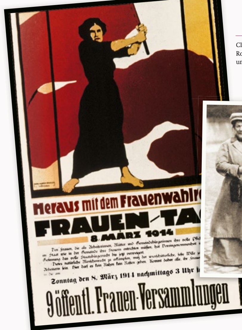
Clara Zetkin (l.) und Rosa Luxemburg (r.), um 1910.

Die 1857 geborene Clara Zetkin war schon früh zur SPD gekommen, wendet sich aber wie Rosa Luxemburg gegen die Politik des sogenannten Burgfriedens – des Zusammenstehens aller Parteien gegen den äußeren Feind, der auch die Sozialdemokraten folgen. Sie organisiert im März 1915 mit der internationalen sozialistischen Frauenkonferenz in Bern ebenfalls einen Friedenskongress; auch die hier aus acht Ländern angereisten Delegierten verabschieden ein gemeinsames Manifest gegen das Völkermorden. Wegen ihrer Antikriegshaltung wird Clara Zetkin mehrfach inhaftiert und von ihren Genossen in der SPD-Führung heftig kritisiert. Doch sie lässt sich nicht einschüchtern, sondern stellt sich an die Spitze einer Protestbewegung, die – vor allem unter den am stärksten unter den heimischen Folgen des Krieges leidenden Frauen aus den ärmeren Bevölkerungsschichten – immer mehr Anhänger gewinnt, als nach zwei Jahren Krieg und Entbehrungen die Kriegsbegeisterung ins Gegenteil umschlägt.