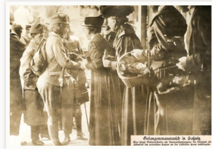
Eine seltene Fotografie mit Originalbildunterschrift: »Gefangenenaustausch in Saßnitz. Eine junge Österreicherin als Austauschgefangene, die seinerzeit als Fähnrich der polnischen Legion an der russischen Front mitkämpfte.«

Europas schließen sich in zwei Bündnissystemen zusammen. Gegenüber stehen sich die Entente – Großbritannien, Frankreich und Russland, denen sich 1915 auch Italien anschließt – und als Zweibund die sogenannten Mittelmächte: die k.u.k. Monarchie Österreich-Ungarn und Deutschland. Beide Lager rüsten militärisch auf, begleitet vom Klima zunehmender nationalistischer Ressentiments. Diese Entwicklung hatte schon vor 1914 wiederholt zu außenpolitischen Krisen geführt und Europa mehrmals an den Rand einer militärischen Auseinandersetzung gebracht. Warnende Stimmen gibt es genug, die auf die schwelende Gefahr eines Krieges aufmerksam machen, allen voran die 1905 mit dem Friedensnobelpreis geehrte Vorkämpferin der pazifistischen Bewegung, Bertha von Suttner. Ihr 1889 erschienenen Buch Die Waffen nieder! war ein Fanal der sich organisierenden Friedensbewegung. Bertha von Suttner stirbt am 21. Juni 1914 im Alter von 71 Jahren, sieben Tage vor dem Attentat auf den österreichischen Thronfolger in Sarajevo, das zum Anlass für den Ersten Weltkrieg wird.