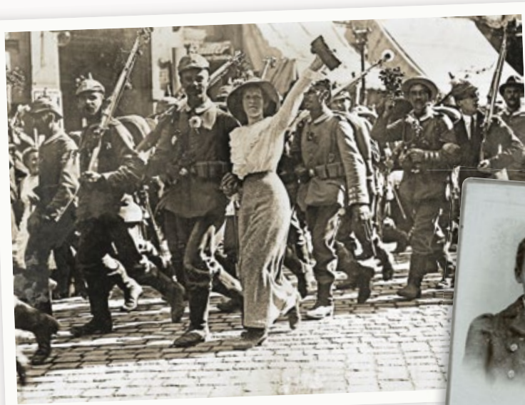
Die ersten Kriegsfreiwilligen in Berlin werden begeistert verabschiedet, August 1914.