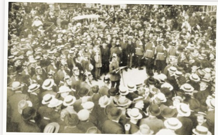
Verkündung der Mobilmachung in Berlin Unter den Linden.

Der Krieg als Chance für die Gleichberechtigung? Es ist ein völlig neues Selbstverständnis der Frauenbewegung, das hier zum Ausdruck kommt. Sich an der Heimatfront bewähren, hier das Ihrige fürs Vaterland zu leisten – dies würde allen beweisen, dass Frauen als Bürgerinnen des Landes den Männern ebenbürtig sind. Die politische Gleichberechtigung müsste dann nicht mehr erkämpft werden, sondern wäre für die Regierung eine natürliche Folge. So jedenfalls die Hoffnung.