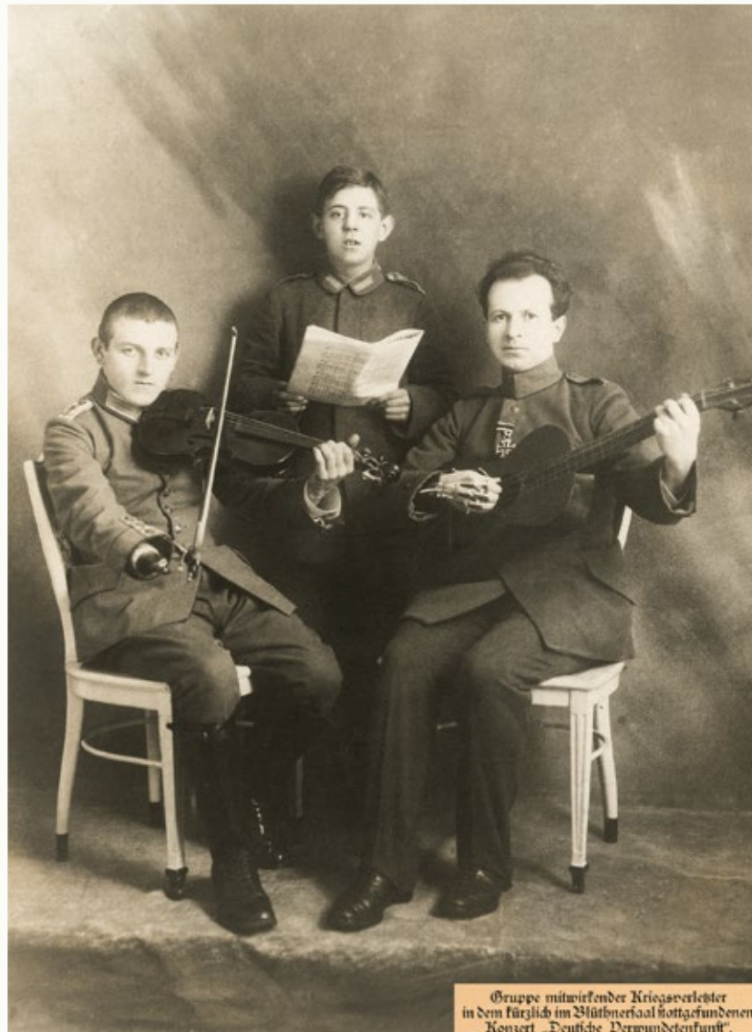
Gruppe mitwirkender Kriegsverletzte in dem kürzlich im Blüthnersaal stattgefundenen Konzert »Deutsche Verwundetenkunst«.

Am 28. Juni 1919 muss in der Weimarer Republik die neu gewählte demokratische Regierung trotz ihres Protests gegen die Zuweisung der alleinigen Kriegsschuld an Deutschland und der nicht zu bewältigenden Reparationszahlungen den Versailler Friedensvertrag unterzeichnen. Für die junge Republik bedeutet dieser Vertrag von Beginn an eine schwere Hypothek. Die sogenannte »Dolchstoßlegende«, nach der die reaktionären Militärs nunmehr die demokratischen Unterzeichner des »Schandfrieden«-Vertrags des Verrats an den »im Felde unbesiegten« Soldaten bezichtigen, ist eine der Ursachen für den Aufstieg der Nationalsozialisten zu Beginn der Dreißigerjahre.